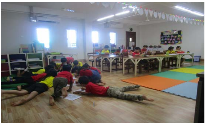
សិស្សថ្នាក់ទី២B កំពុងរីករាយក្នុងការសិក្សាលើប្រធានបទថ្មី ។ សិស្សទាំងអស់ខិតខំរៀនសូត្រក្នុងថ្នាក់រៀនថ្មីរបស់ពួកគេ ។